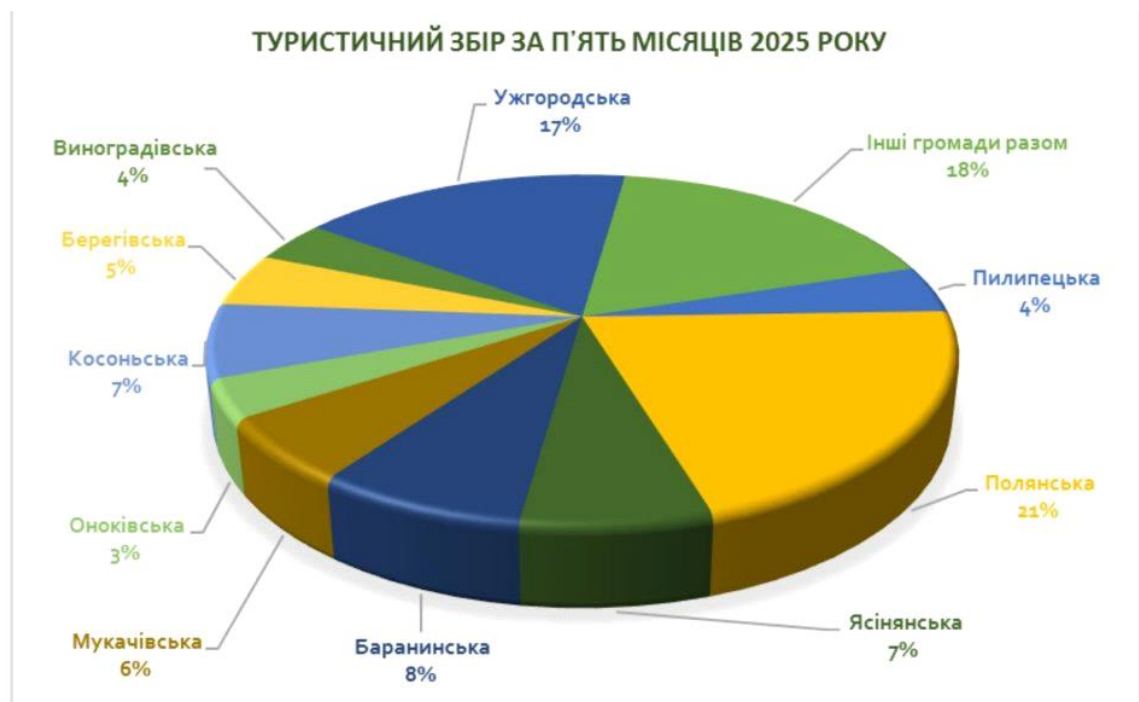
Рис. 2. 3 Частка ТГ в обсязі туристичного збору за січень-травень 2025 р.

підтримку місцевих фермерів і стимулювання розвитку малого бізнесу. Завдяки даному проекту Ясінянська громада прокладає шлях до реалізації свого природного потенціалу задля сталого розвитку, перетворюючи дари карпатських лісів на ресурс для економіки.