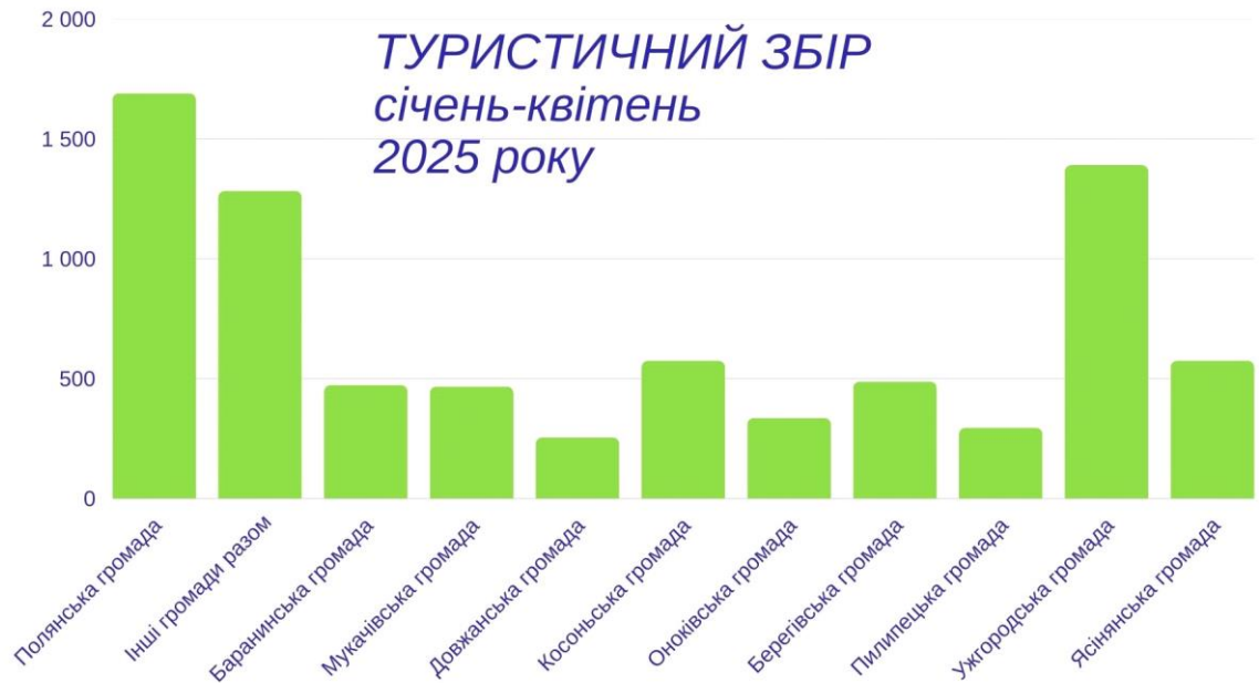
Рис. 2. 2 Обсяги туристичного збору за період січня-квітня 2025 р.

У селищі Ясіня до бюджету поступило 574,7 тис грн за означений період.