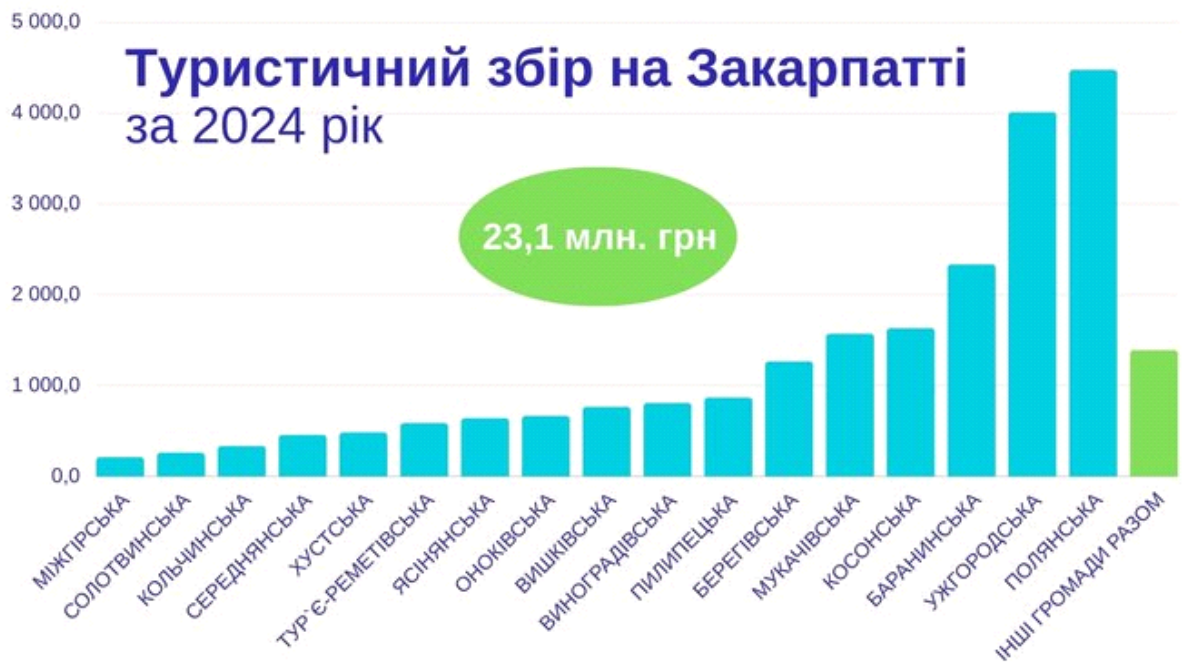
Рис. 2. 1 Обсяги туристичного збору в розрізі територіальних громад області

- юридичними особами в обсязі 10 387 200 грн [31].