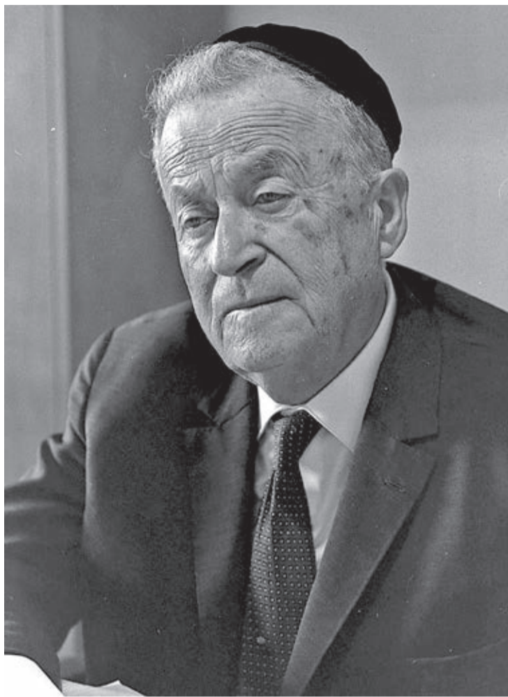
SZMUEL JOSEF AGNON W 1945 R.

Oprócz zajęć domowych matka zapoznawała go z literaturą niemiecką, a ojciec – z utworami