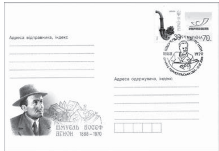
STEMPLOWANA KOPERTA ZE ZNACZKIEM Z OKAZJI 120. ROCZNICY URODZIN SZMUELA JOSEFA AGNONA, BUCZACZ, 2008 R.