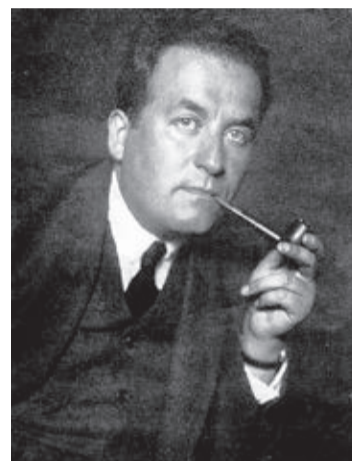
SZMUEL JOSEF AGNON W OKRESIE MIĘDZYWOJENNYM