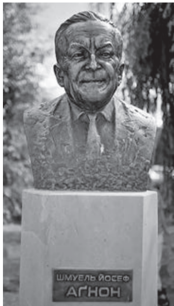
POPIERSIE SZMUELA JOSEFA AGNONA W BUCZACZU

Odwiedziny rodzinnych stron zaowocowały powieścią „Gość na jedną noc”. W Buczaczu zastał ruinę materialną i duchową. „Gdziekolwiek spojrzysz – pisał Agnon, – wszędzie jedynie bieda i niedostatek”. Każdy dom, każde rumowisko przykuwało jego uwagę, wywoływało wspomnienia o tak drogiej przeszłości i napełniało smutkiem wrażliwą duszę. Nawet studnia, z której król Sobieski pił wodę, wracając ze zwycięskiej wyprawy, była zaniedbana i opuszczona: schody rozbite, a napis na tablicy zatarty. Na ulicach akacje,