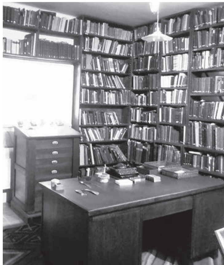
GABINET AGNONA W IZRAELU, 2009 R.

Treścią jego pierwszej powieści jest niepowtarzalny koloryt żydowskich zwyczajów chasydzkich w małych