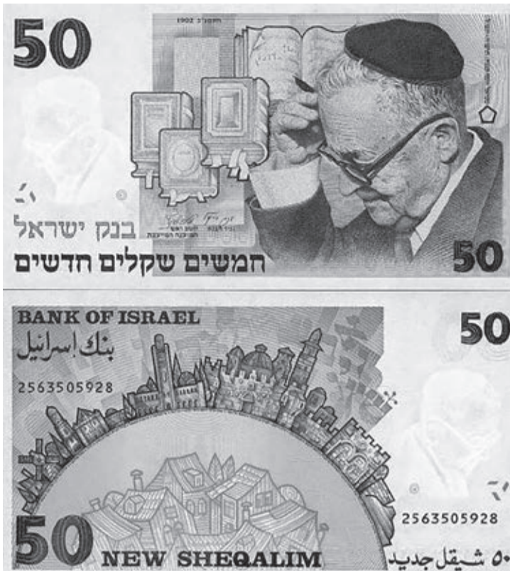
BANKNOT O NOMINALE 50 SHEKLI Z 1988 R. Z OKAZJI 100-LECIA URODZIN SZMUELA AGNONA