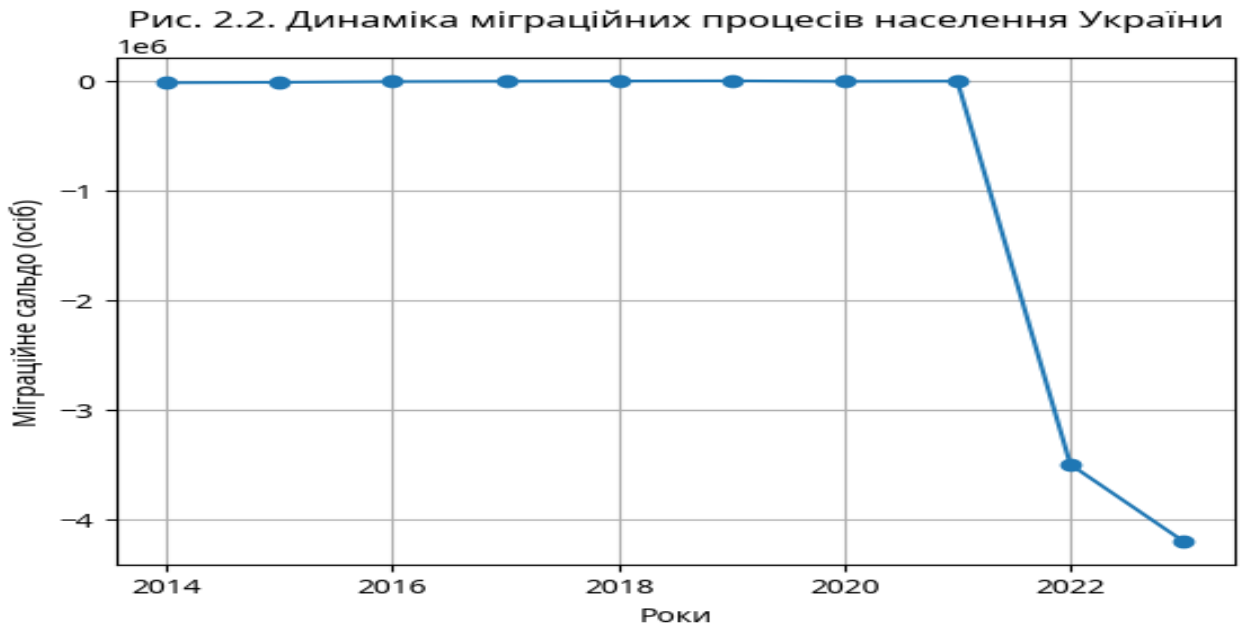
Рис. 2.2. Динаміка міграційних процесів населення України