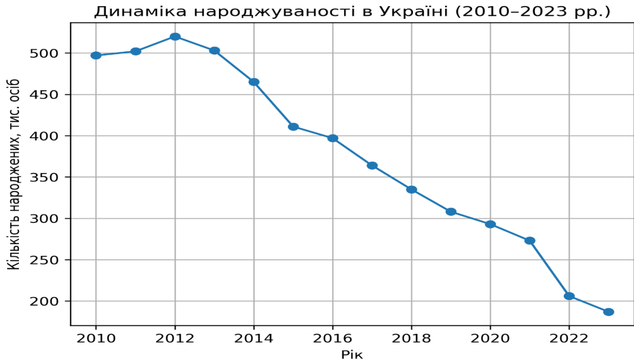
Рис. 2.1. Динаміка народжуваності в Україні (2010–2023 рр.)

вага працездатного населення. У результаті цього підвищується навантаження на економіку, систему соціального забезпечення та інші сфери суспільного життя.